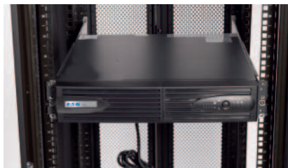
Als 2HE-Einheit im Rack